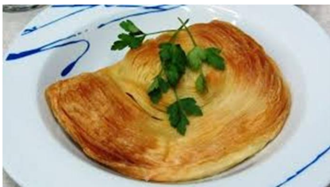
Imagem – Pastel de molho da Covilhã

Para tal, o pastel é colocado num prato de sopa e o molho de açafão é deitado quente por cima. Tapa-se com um outro prato para abafar e o pastel abrir, para se comer à colher, como de uma sopa se tratasse. Há, no entanto, algumas pessoas que preferem comê-lo seco.