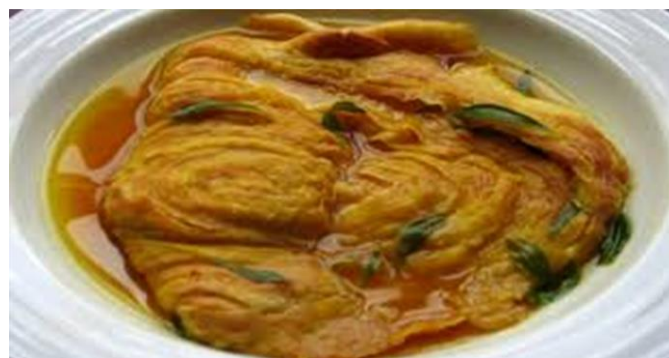
Imagem – Pastel de molho da Covilhã

3 dl de água 1 colher de sopa de vinagre sal 3 pés de salsa alguns fios de açafão