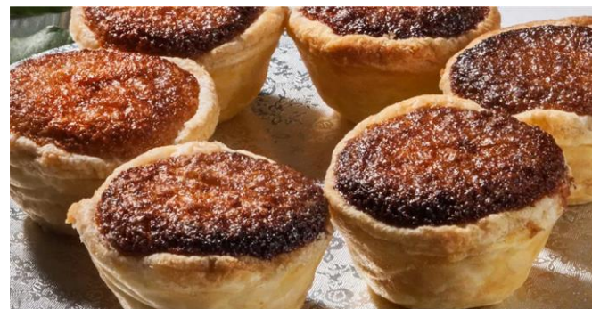
Imagem - Pasteis de toucinho de Arraiolos

Levam-se ao forno previamente aquecido a 180º.