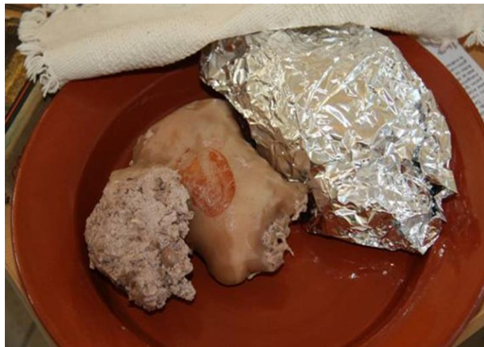
Imagem - Mangotes

Representatividade na alimentação local: Era servido por tradição no Natal e durante as matanças dos porcos.