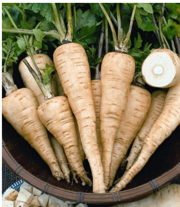
Imagem – Cherovia/Pastinaca

Tradicionalmente a Pastinaca em Portugal é cultivada na zona da Serra da Estrela, sendo, contudo, possível o seu cultivo noutras zonas do país. Esta planta, no entanto, não cresce em climas quentes e necessita da geada para desenvolver o seu sabor. Pelo tipo de raiz que é, a Pastinaca prefere terrenos arenosos e/ou limosos. Terrenos argilosos ou pedregosos dificultam o seu crescimento, provocando raízes deformadas e de pequeno tamanho.